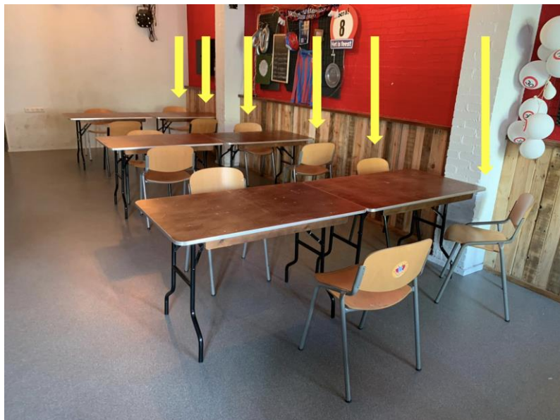
Figuur 2 Indeling tafels Badtrand. Gele pijlen wijzen de 'ingesloten'-zitplaatsen aan.